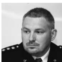
Lektors: Artis Velšs Valsts policijas priekšnieka vietnieks, Galvenās kārtības policijas pārvaldes priekšnieks

Valdis Voins ir jurists, Tiesību zinātņu doktora grāda kandidāts, atvaļināts policijas ģenerālis. Vairāk nekā 30 gadus strādājis iekšlietu struktūrās. Līdz 2011. gadam bijis Valsts policijas priekšnieks. Pašlaik Valdis Voins ir Latvijas Basketbola savienības priekšsēdētājs, Rīgas Ostas policijas priekšnieks. Ir vairāku publikāciju autors, pasniedzējs.