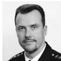
Lektors: Kristaps Eklons Priekšnieka vietnieks, pulkvedis

Artis Velšs dienestu iekšlietu ministrijas sistēmas iestādēs uzsāka 1993. gadā. No 2013. gada kā Valsts policijas priekšnieka vietnieks un Galvenās kārtības policijas pārvaldes priekšnieks atbild par licencēšanas, sertifikācijas un atļauju sistēmas, tajā skaitā Apsardzes darbības sertifikācijas komisijas darba nodrošināšanu, sabiedriskās kārtības nodrošināšanu un policijas spēku iesaistīšanu publisku pasākumu laikā.