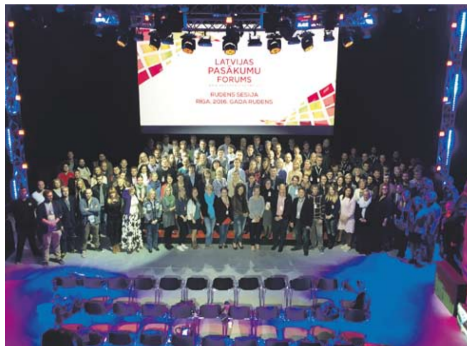
■ Latvijas Pasākumu foruma 1. rudens sesijas dalībnieki uzņēmuma “Kompānija NA” studijā (2016)

LATVIJAS PASĀKUMU FORUMA ATBALSTĪTĀJI IR: