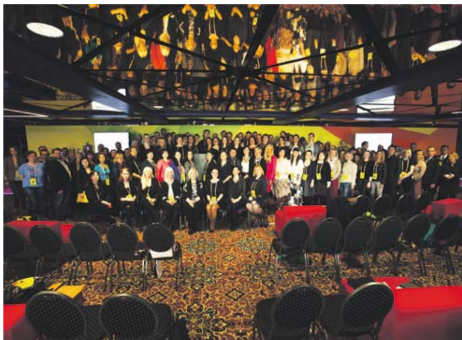
■ 1. Latvijas Pasākumu foruma dalībnieki Rīgā (2015)