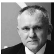
Lektors: Valdis Voins Ostas policijas priekšnieks

Līdzīgi kā iepriekšējos gados, Latvijas Pasākumu foruma drošības paneli tiks aplūkoti pasākumu drošības jautājumi. Iepriekšējos gados drošības paneļu tēmas ir bijušas dažādas – valsts un pašvaldības iestāžu darbība apdraudējuma gadījumā, pasākumu rīkotāju rīcība pasākuma atcelšanas gadījumā, valsts un pašvaldības drošības institūciju atbildības nošķiršana, NMPD darbība pasākumos, globālais apdraudējums, dronu izmantojums pasākumu teritorijā. 2017. gada drošības paneli plānots pievērst uzmanību sekojošām tēmām – globālā apdraudējuma ietekme uz pasākumu norisi Latvijā, normatīvo aktu novitātes drošības jomā, pasākumu apsardzes organizācija un nodrošinājums, apsardzes sertifikācija.