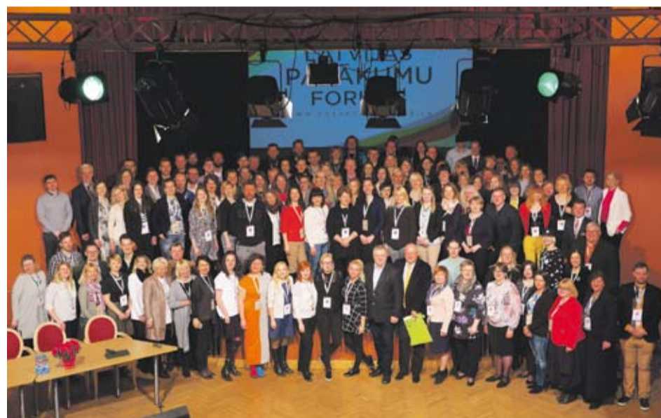
■ 2. Latvijas Pasākumu foruma dalībnieki Ventspilī (2016)

Pirmais Latvijas Pasākumu forums notika 2015. gadā Rīgā un Cēsīs, savukārt otrais – 2016. gadā Ventspilī. Sākot ar 2016. gadu, rudenos tiek rīkota Latvijas Pasākumu foruma rudens sesija, kas veltīta pasākumu tehniskā aprīkojuma jautājumiem. Pirmā Latvijas Pasākumu foruma rudens sesija notika 2016. gadā uzņēmuma “Kompānija NA” studijā. ■