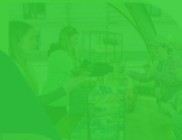
Trash art EXPO

KOMPENSĒŠANA – SAŅEM PRET SAVU IZMANTOTO STARTA NUMURU SAŅEM EGLĒS STĀDU